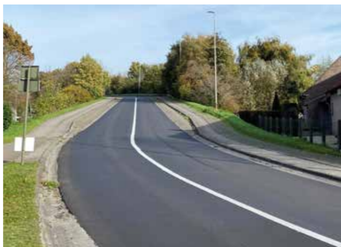
De nieuwe asfaltlaag in de Baron de Giey laan