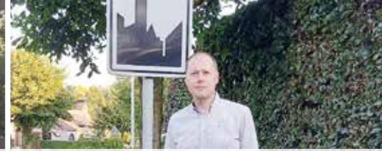
Wat met gemeentefusies? (p.3)