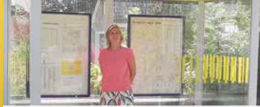
Nieuw vervoersplan De Lijn (p.2)