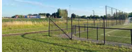
Bufferbos tussen Sportpark Moerkensheide en E17 (p. 3)