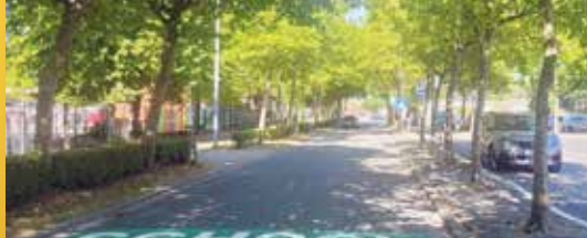
Veilig naar school (p.2)